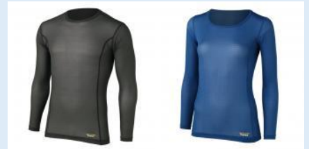
※各メーカーパドルングウェア、取り扱っています。

ファイントラック アクティブスキン ロングスリーブ Men's ¥5,000 Women's ¥4,700 タイツ Men's ¥4,700 Women's ¥4,300 ※価格は税抜きです